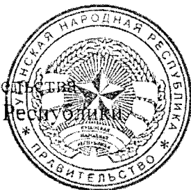
С. И. Козлов

Председатель Правительства Луганской Народной Республики